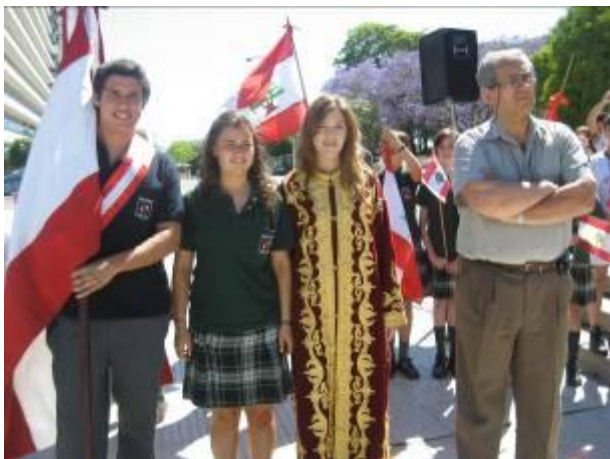
BUENOS AIRES: Alumnos del Colegio San Maron en la Plaza San Martin

Mostramos aquí algunas imágenes de los Actos Oficiales realizados.