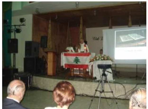
MISA EN EL CLUB LIBANES, SIRIO, PALESTINO DE SANTO DOMINGO con motivo de la celebración de la Independencia del Líbano.

Con motivo de la celebración del segundo festival de cine internacional en Rep. Dominicana, luego de la proyección de la película Libanesa Caramel.