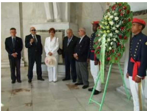
SANTO DOMINGO: Autoridades Locales y Comunidad Libanesa realizando una Ofrenda Floral en el altar de la patria donde se encuentran la tumbas de los padres de la Patria.