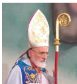
Su Beatitud, el cardenal nasral a butros sfeir

“SAN MARÓN: un testimonio de fe y recorrido de UN PUEBLO”.