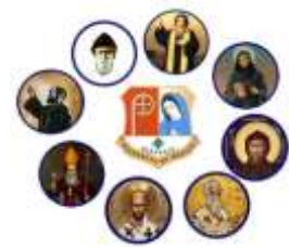
Los santos maronitas

“Los Santos, sin excepción, viven todos en lo más profundo de una fe firme, segura e imitativa ya que esta fe permanece radiante en ellos incluso después de su muerte. Es la fe que no se manifiesta, arraiga y renueva continuamente sino en virtud de su relación peculiar con Dios Padre, el Cristo Señor y el Espíritu SANTO. “ESTA es la fe inamovible que fue la base sobre la cual se elevó la Iglesia MARONITA”.